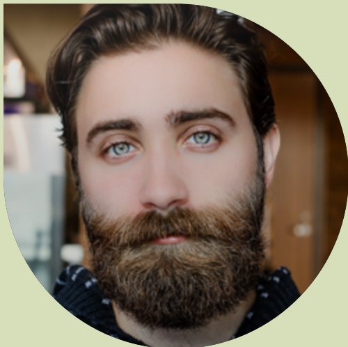
ILLUSTRATION CLINIQUE* DE L'EXERCICE DE L'ACTIVITÉ RÉSERVÉE POUR L'ERGOTHÉRAPEUTE – 2