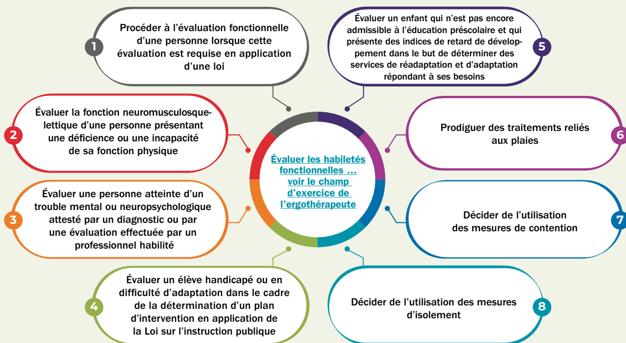
Figure - 2

Finalement, il est à noter que l'utilisation des outils d'évaluation n'est l'objet d'aucune activité réservée 62 , et ce, bien que ces outils puissent être utilisés dans le cadre de la réalisation d'une activité réservée par une professionnelle ou un professionnel habilité. Il n'en demeure pas moins que le choix de l'outil d'évaluation s'effectue en fonction de certains critères 63 ayant notamment trait à la pertinence clinique et à la compétence requise.