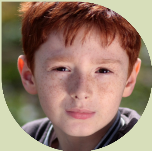
ILLUSTRATION CLINIQUE* DE L'EXERCICE DE L'ACTIVITÉ RÉSERVÉE POUR L'ERGOTHÉRAPEUTE